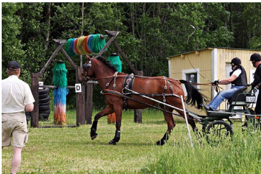
Macken är ett av de fasta hinder som finns på köranläggningen Johannesberg.

Välkommen till denna introduktion till sportkörning med häst och vagn!