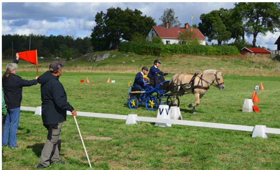
Ekipaget får just startsignal för precisionsmomentet.

Sportkörning är relativt förskonad från olyckor, men som i alla verksamheter med djur inblandade ska man ha respekt för de risker som kan uppstå. Hästar är flyktdjur och även den mest vältränade hästen kan få panik och hoppa till. På tävlingsbanan kan det inträffa att vagnar fastnar i hinder eller välter. Det är därför hjälmkrav på både kusk och groom i alla moment, i maraton krävs dessutom skyddsväst. Hästen ska i samtliga moment vara korrekt anspänd. Huvudlag med nosgrimmor ska användas, skygg-lappar bör användas. Normalt används träns- eller stångbett. Kusken ska sitta på kuskbocken och hålla i tömmar och