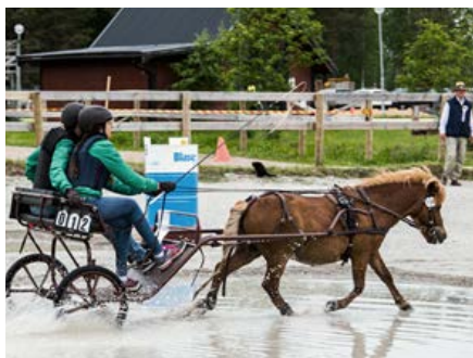
Ponnyer passar utmärkt för körning, här ett ponnyekipage som tävlar hos Dala Kuskällskap.

Genom att köra en häst skapas en varierad träning utan onödig belastning. När hästen jobbar genom kroppen med vikten i en vagn bakom sig, stärks baddelmuskulatur och rygg. Dessutom minskar risken för belastningsskador och hältor. Det är lämpligt att aktivera unghästar med tömkörning och körning så att de bygger upp sina ryggmuskler innan det är dags att bära ryttare. En väl inkörd häst blir ofta mycket stark och hållbar av körningen och kan ofta tävlas högt upp i åldrarna, till glädje för alla inblandade. En bra ridhäst är även en bra körhäst, liksom en bra körhäst är en bra ridhäst. Till exempel så rids och tränas alla körhästar under ryttare på Hovstallet för att erhålla starka och hållbara hästar.