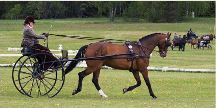
Ett ekipage med gigg under dressyrmomentet på en tävling på Johannesberg.