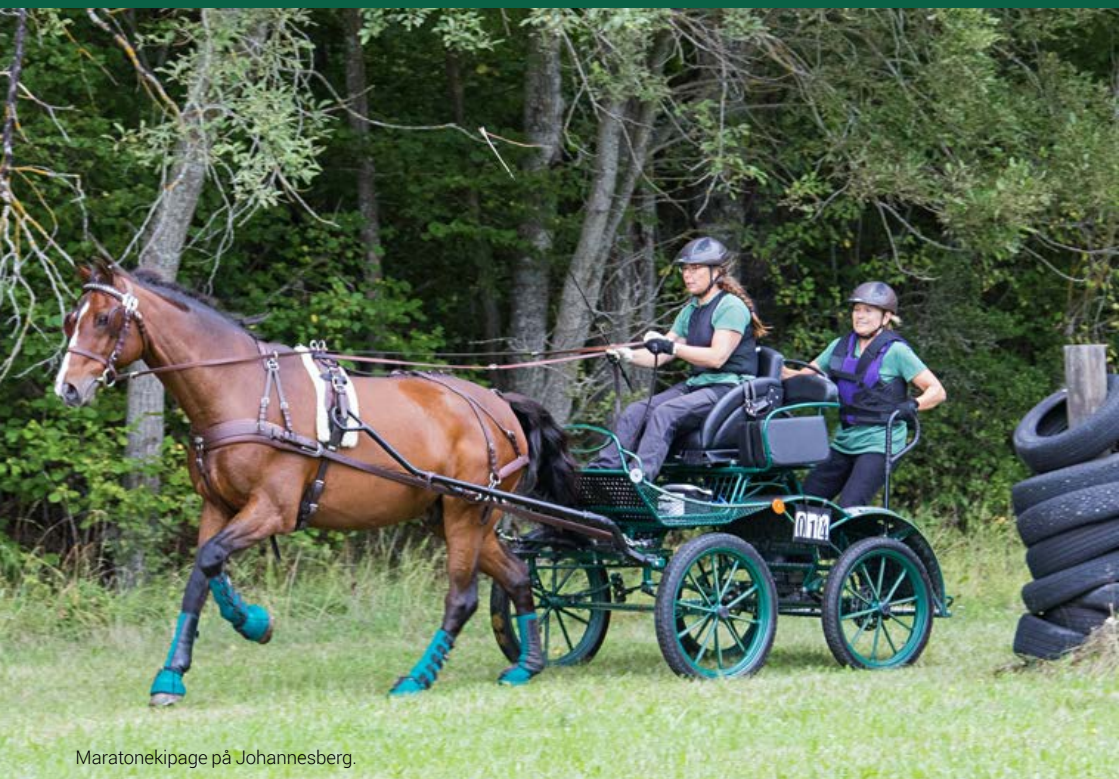
Maratonekipage på Johannesberg.

En introduktion till ett gammalt kulturarv och en spännande modern hästsport!