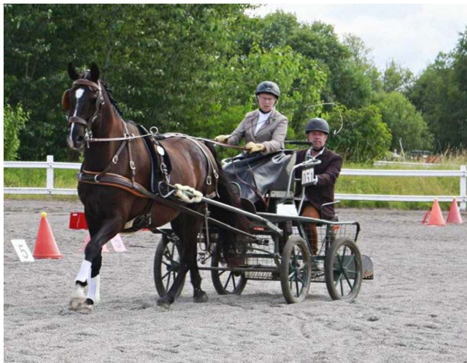
Tävlingens precisionsmoment körs ofta på en ridbana. Ekipaget tävlar med maratonvagn.

En "fullständig körtävling" med tre moment kan tävlas på en, två eller tre dagar. En endagstävling börjar med dressyr följt av maraton med inlagd precision. En tvådagars tävling innehåller