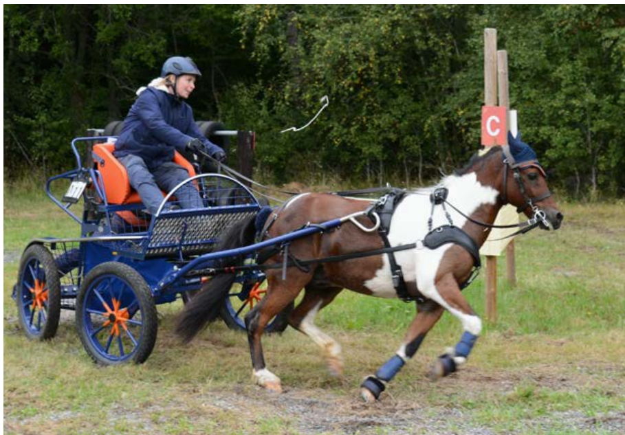
Ett ponnyekipage i full fart genom ett marathondrager på Johannesberg.

De flesta ponny- och hästraser kan användas som körhästar, alltifrån shetlandspanny till nordsvenskar. Vanligast är dock varmblod, till exempel svenskt halvblod. Hästen bör vara trygg,